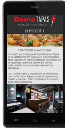
Información y contacto