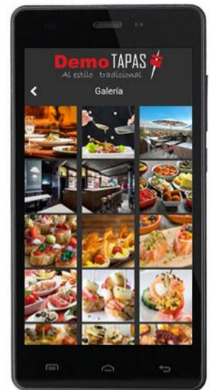
Galería de imágenes